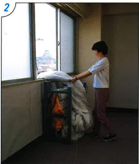
●袋本体を降下させ