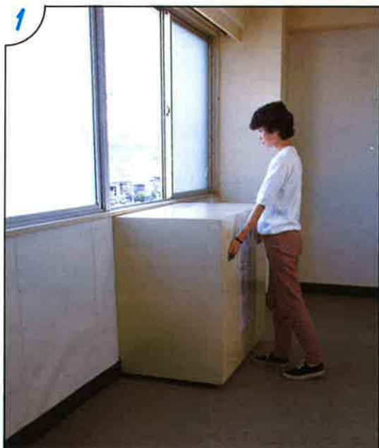
●キャビネットを取除き