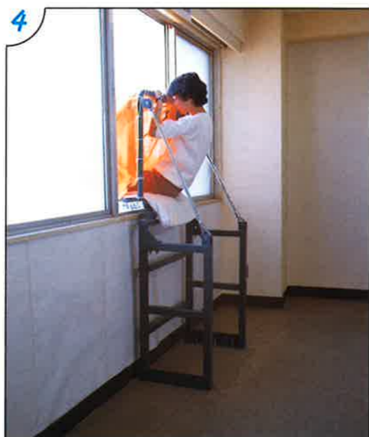
●降下は出来るだけ膝を少し曲げ尻部で 降下する様にして下さい