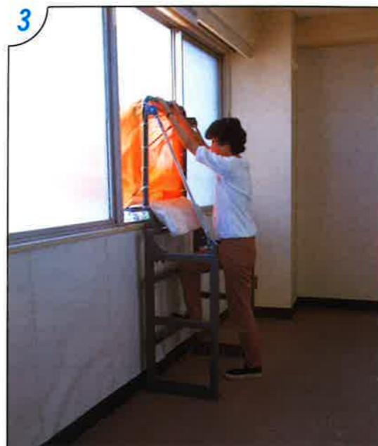
●入口枠を引起こして 足より降下して下さい